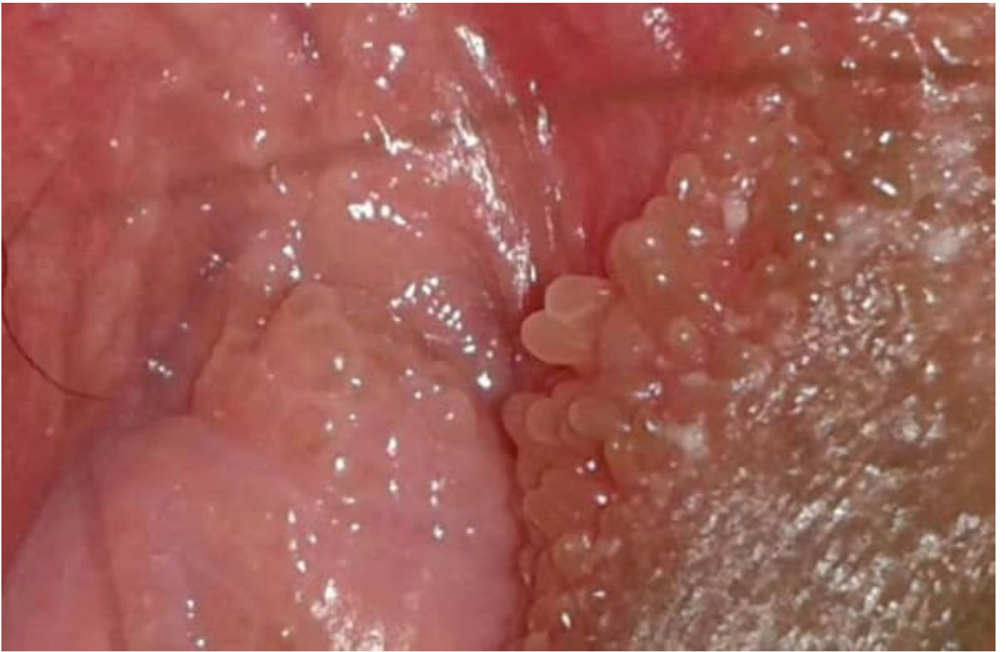
Hình ảnh nốt sùi mào gà tại trong vùng kín