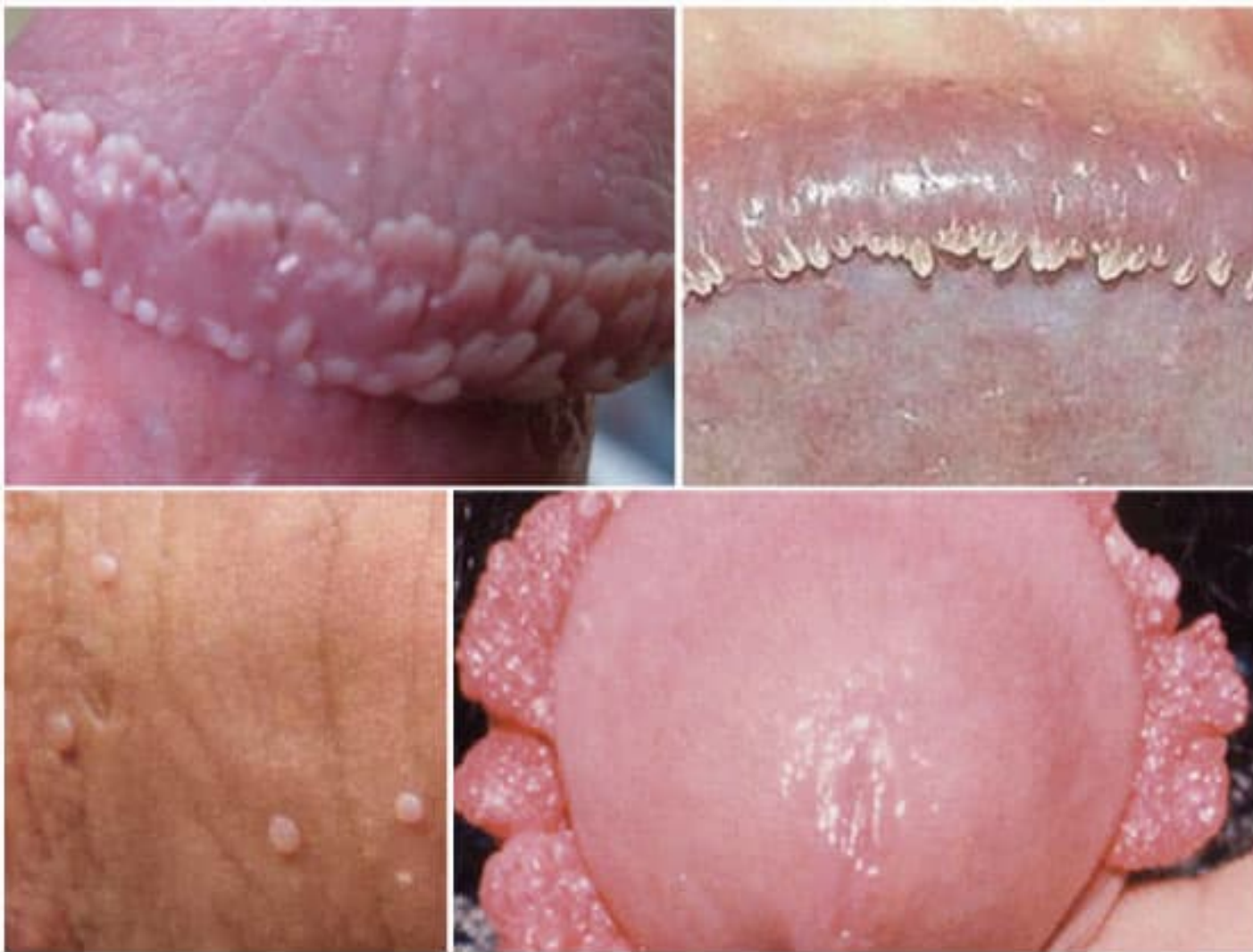
Hình ảnh sùi mào gà ở dương vật